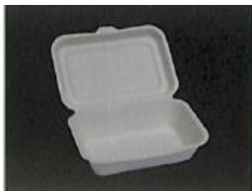
⑫フードパック M 127×171×52mm