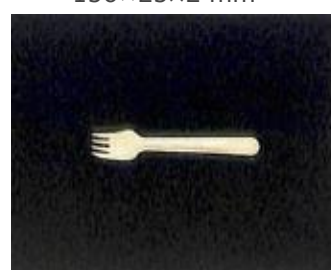
⑭木製フォーク 156×25×2 mm