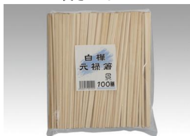
⑰お箸 長さ 210mm