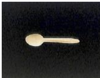
⑬木製スプーン 160×36×2 mm