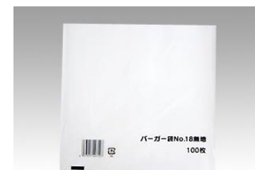
⑮バーガー袋 S 152×150 mm