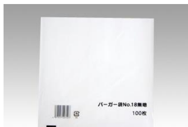
⑯バーガー袋 M 182×180 mm