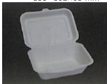
⑪フードパック L 135×182×65 mm